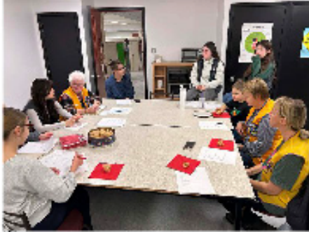
Echange concernant les futures activités

Ce fut une belle rencontre Leo/Conseillers Lion.