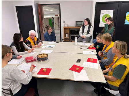
Échange concernant les futures activités

Ce fut une belle rencontre Leo/Conseillers Lion.