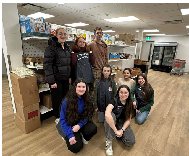
Les membres du club Leo