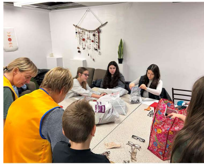
Inspection des lunettes