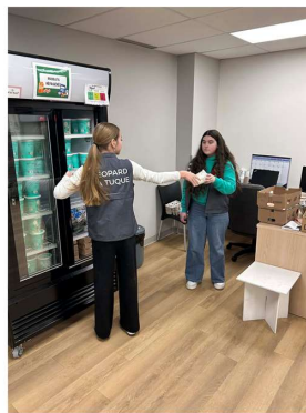
Échange concernant les futures activités