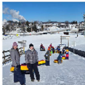
Les Leo aux glissades

Elles ont beaucoup apprécié ! Les jeunes leur ont demandé de revenir. C'est une activité à renouveler !