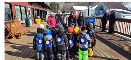
Les Leo lion Lise et les jeunes du C.P.E.