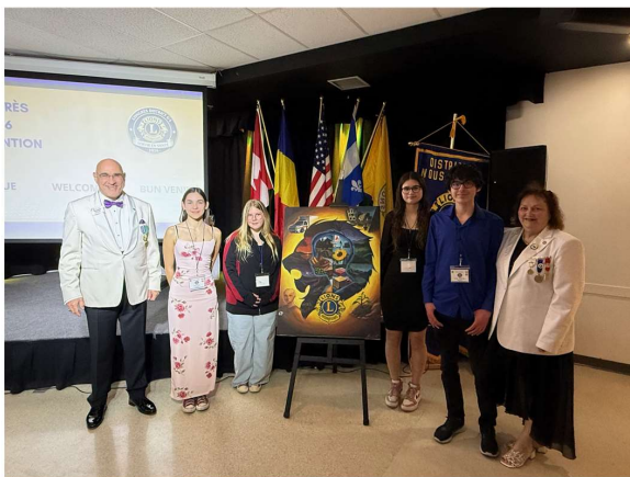
Sur la photo de gauche a droit :