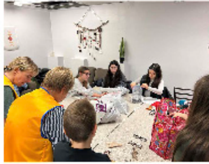
Inspection des lunettes