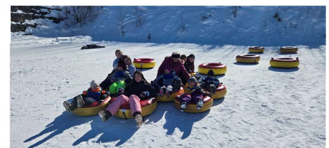
Les Leo les jeunes du C.P.E. Lion Lise