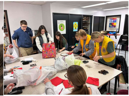
Rencontre du 14 janvier 2026