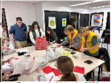
Rencontre du 14 janvier 2026