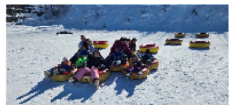
Les Leo les jeunes du C.P.E. Lion Lise